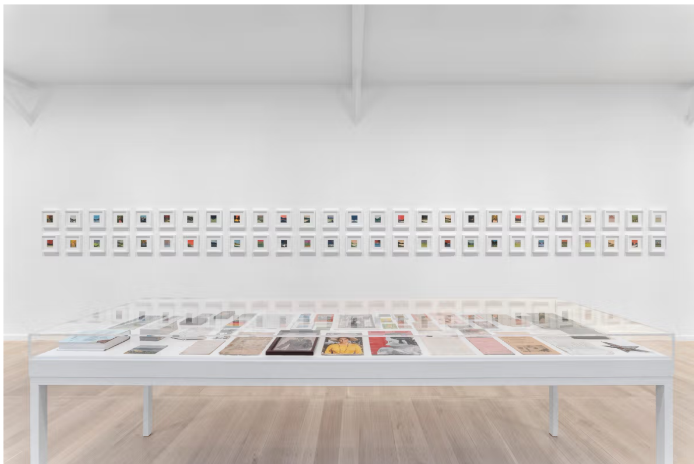
Vue de l'exposition « Frank Walter : Moon Voyage » chez David Zwirner Paris.