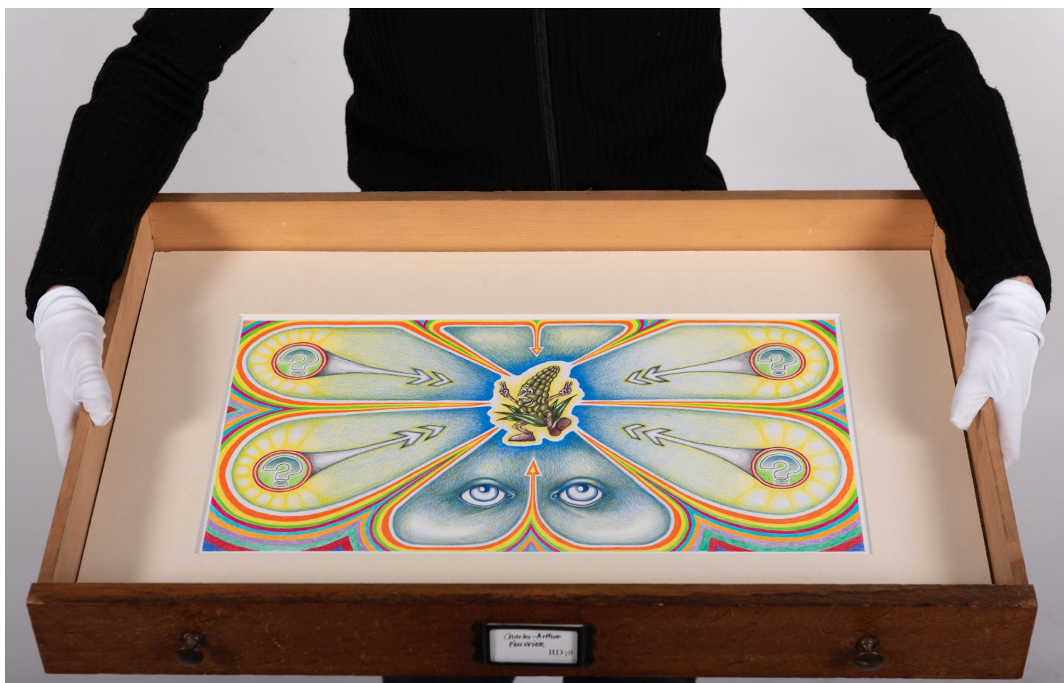
E-261-1, 2025. Vue d'exposition « Cabinet Institute ». Charles-Arthur Feuvrier.