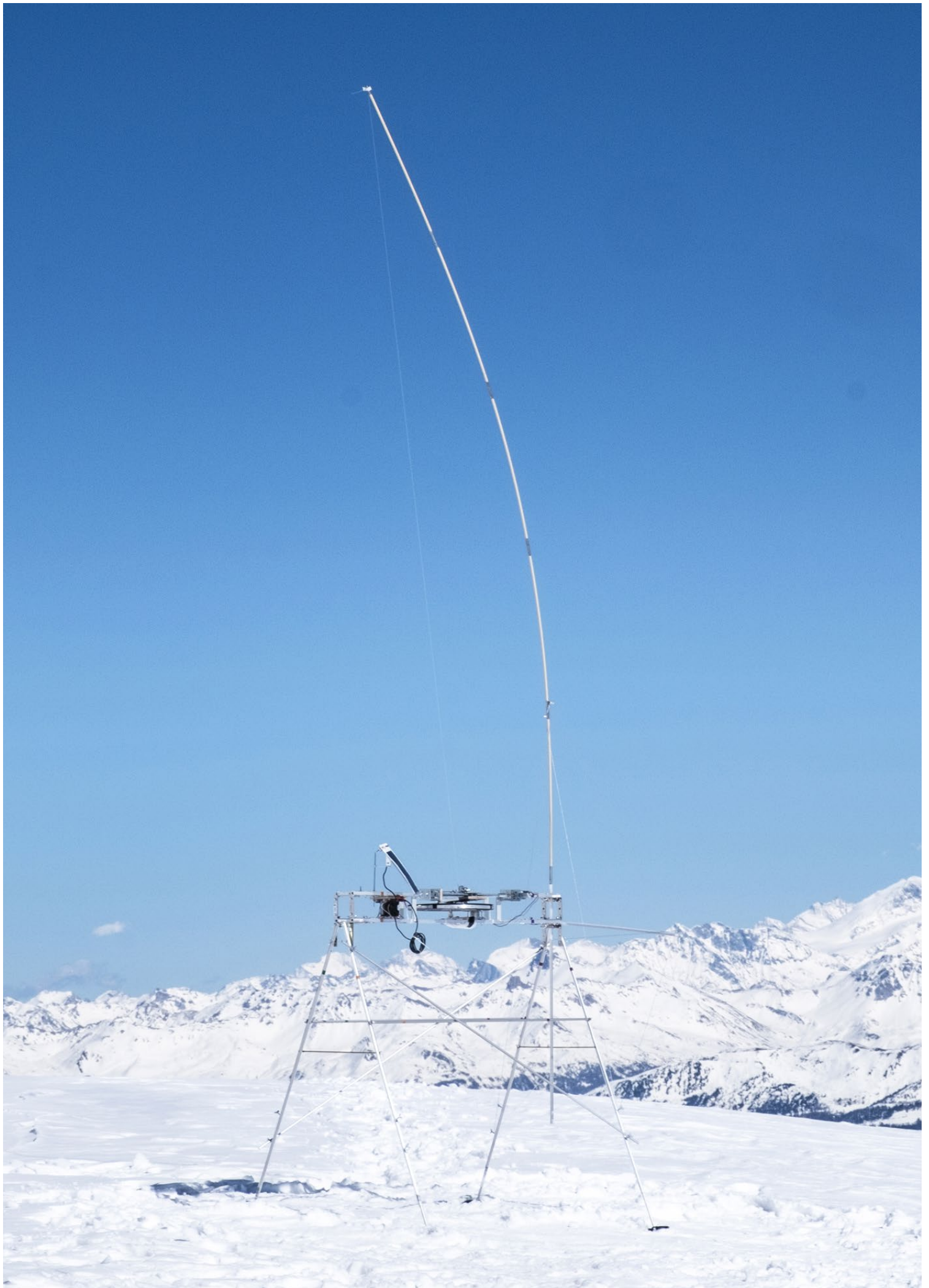
Phonographe à vent, 2023