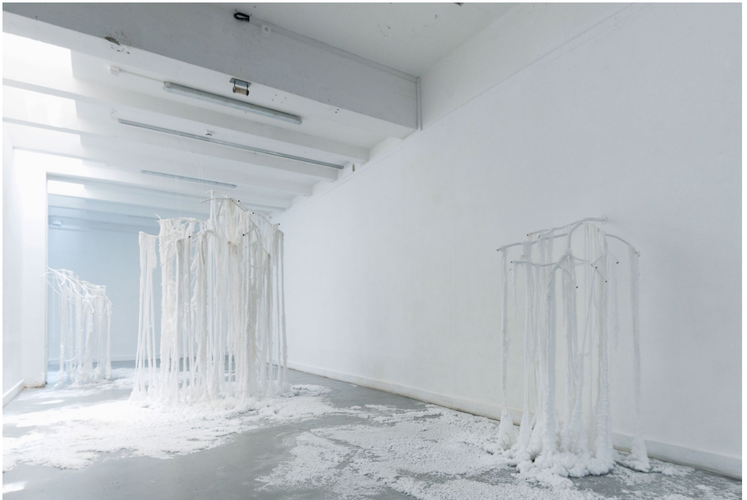
Lorsque la neige nous rattrapera, 2025 Installation In situ. Gabriela Guyez.