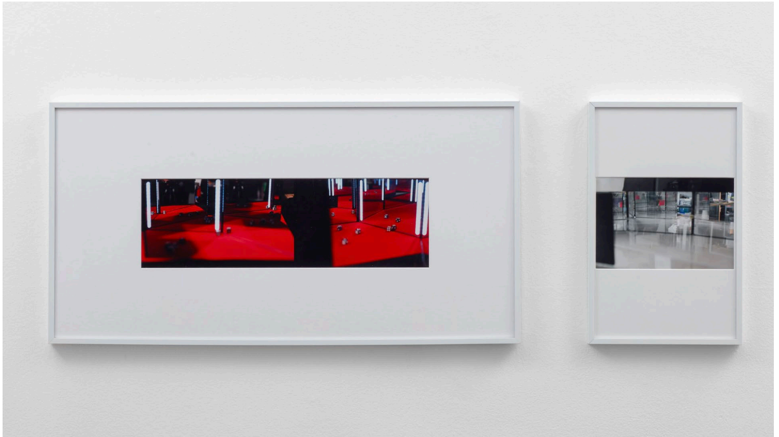
Penny Machine, 2026. Cicadas, Chaos Magic, Foreign (2), 2026