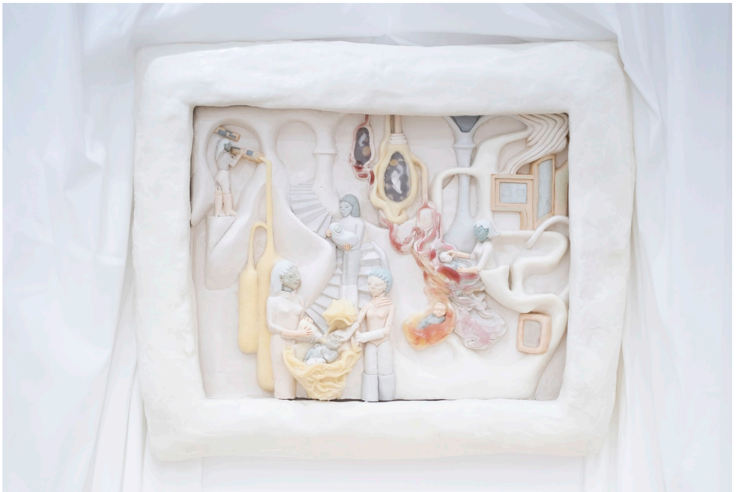
La Nurserie des Vieilles , 2026. Photo : Bellise Perrin La Naissance sacrée , 2025. Photo : Bellise Perrin