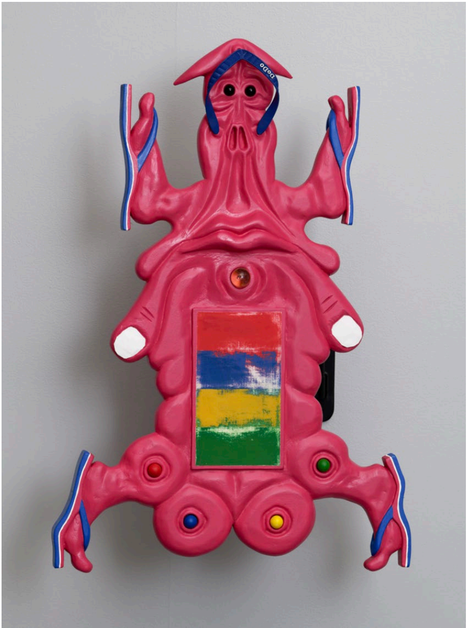
Savat DoDo 2, 2024 Charles-Arthur Feuvrier Fok Shan.