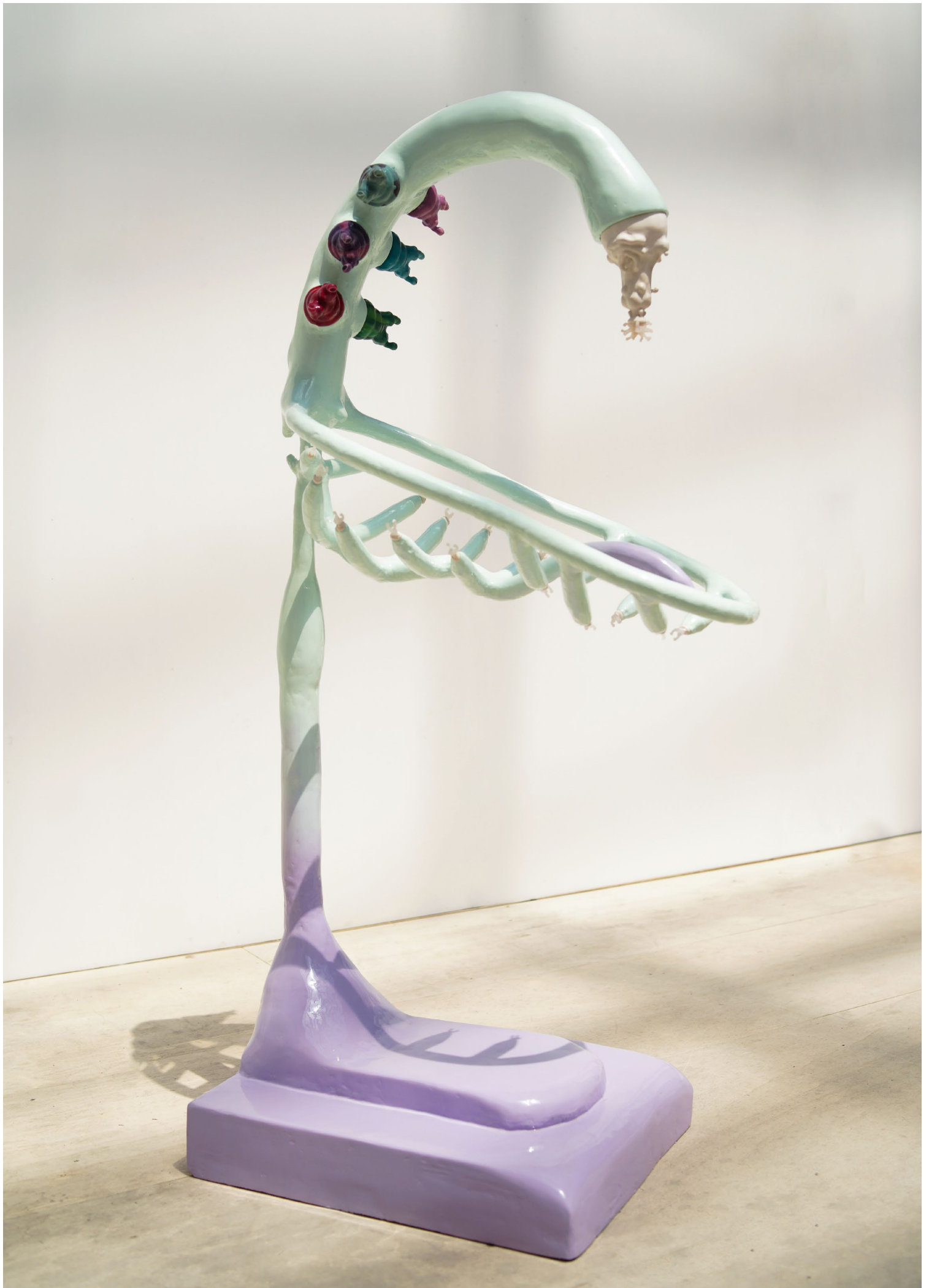
Le Berceau Hypnopedique , 2023 Diane Segard