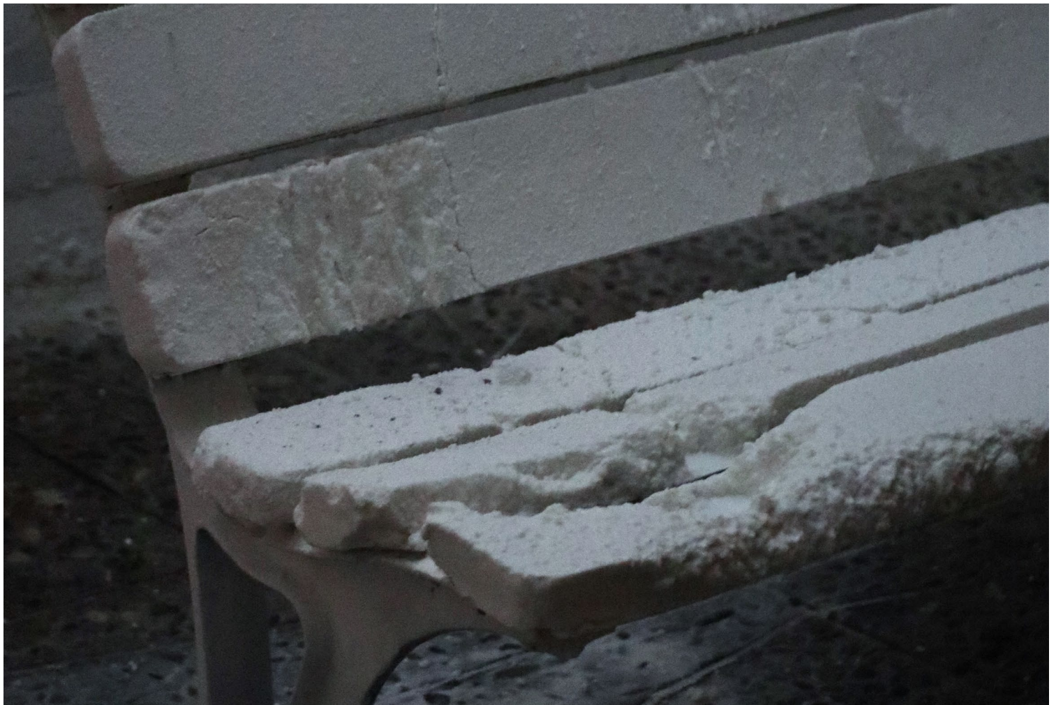
On s'assoira sur la neige, 2025

Installation In situ. Gabriela Guyez.