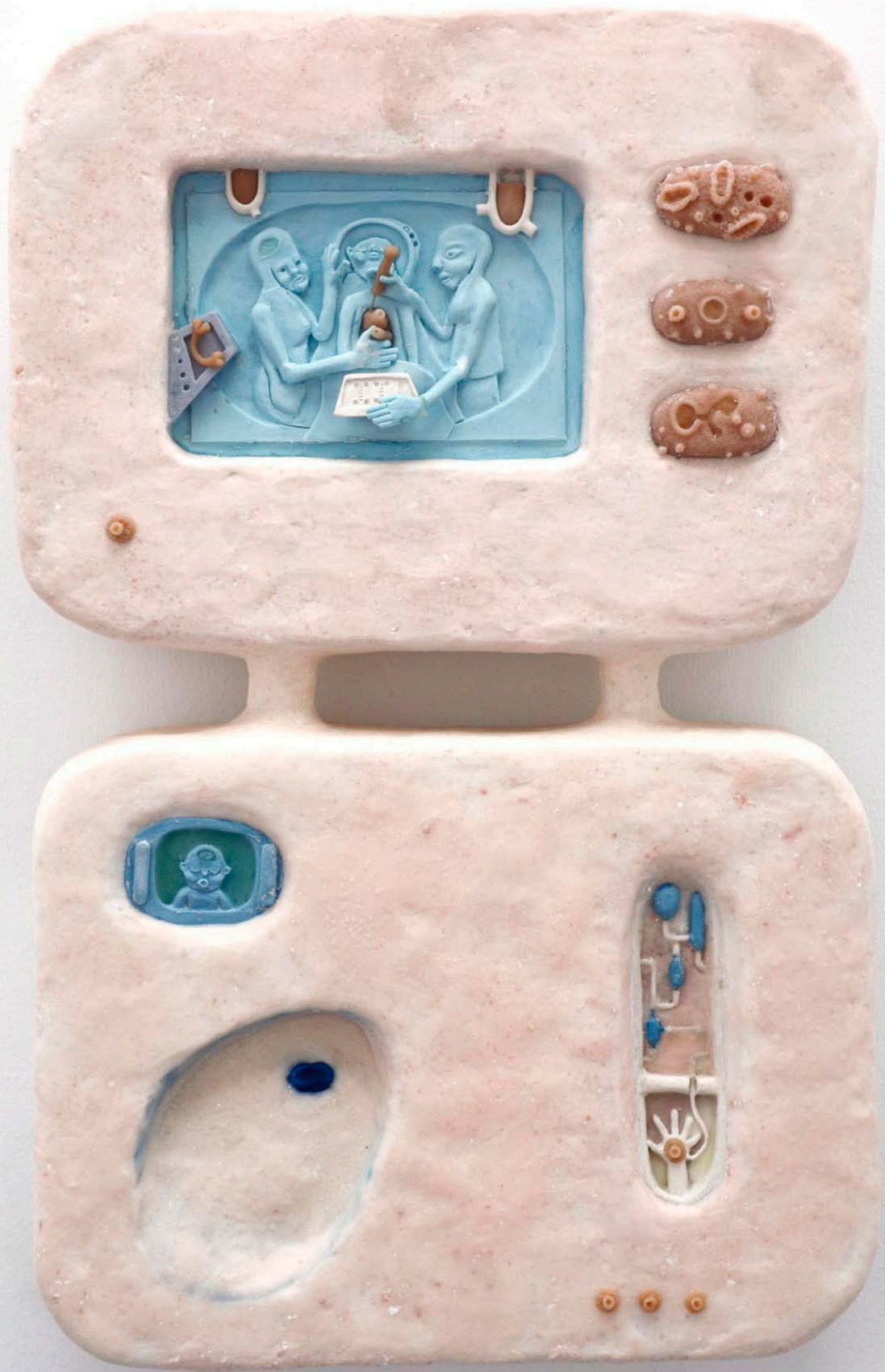
Le remplacement des organes, 2024 Diane Segard