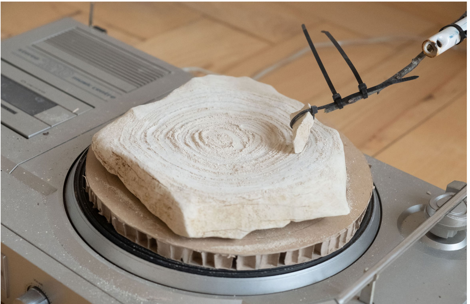
Sédiments sonores , 2023 Remy Bender.