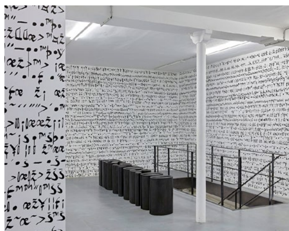
Ni Haifeng The Para-Textual , vue de l'exposition à la galerie In Situ - Fabienne Leclerc, Paris.