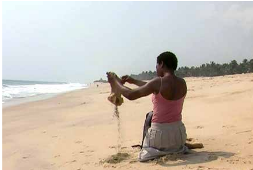
Baggage 1972; 2007-2008: Empty and refill at Eleko Beach, Lagos.

ON I have one... it's just that it hasn't yet started! It's got me very excited. It's a monument that relates the histories of different places within the context of Germany. It commemorates a certain kind of connection between the West and the South. A lot of times, when I go places, that connection only occurs in ethnographic museums. There isn't a big outdoor monument that everybody knows tells a story about what happened in the past, and in a possible future.