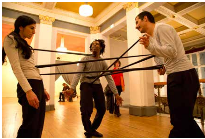
Face me, I Face you at "Berliner Herbst salon", Maxim Gorki Theater, Berlin, 2013.