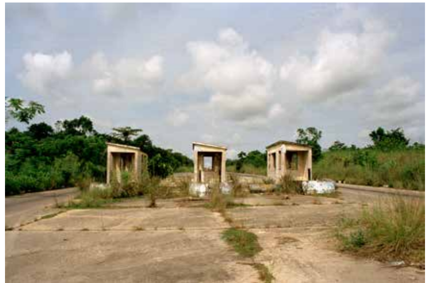
Left - Emptied Remains: Truncate, Visselhovede Rotenburg, 2004-2005. Right - Emptied Remains: Checkpoint, 2004-2005.