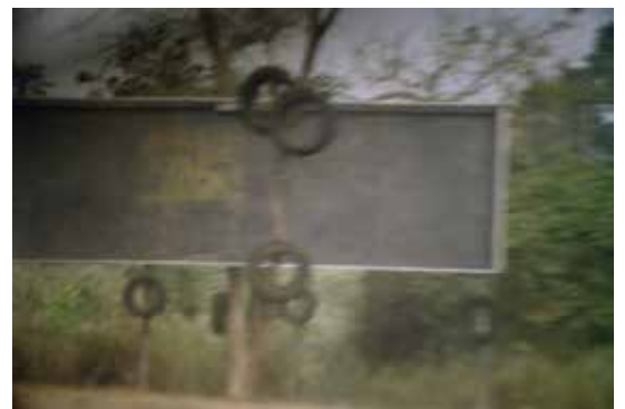
From Left to Right - Road Series VIII, Toll Gate to Ibadan , Road Series IX, Toll Gate to Ibadan , Road Series VI, Toll Gate to Ibadan . All works: 2001.