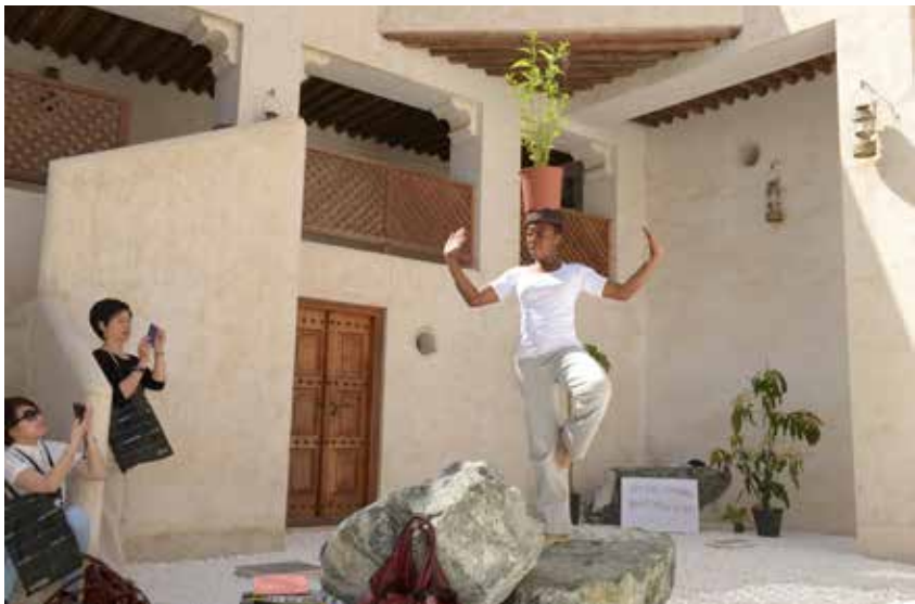
Above - Taste of a Stone: Itiat Esa Ufok at Bait Khalid bin Ibrahim El Yousif, Sharjah, 2013.