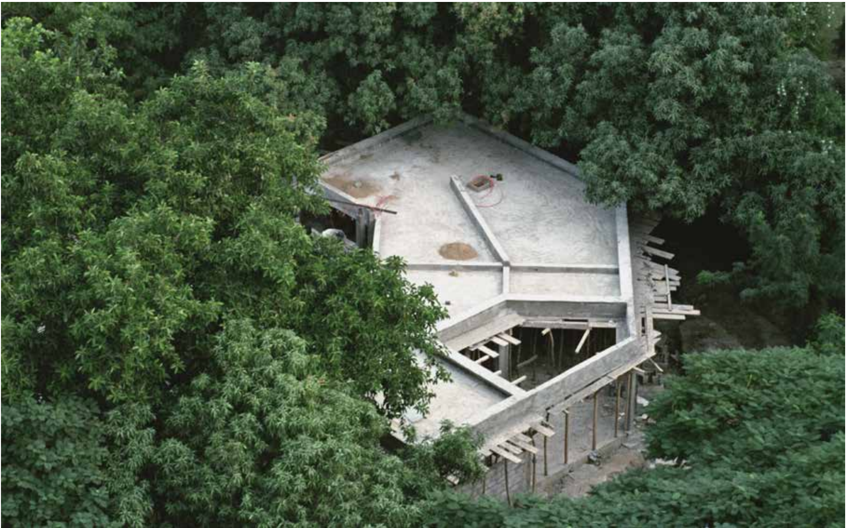
Stripped Bare IV, 2003-2004.