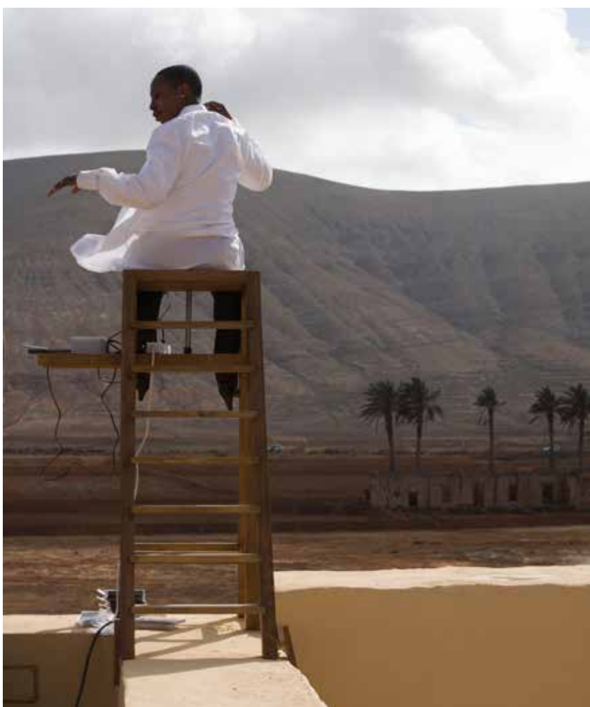
Opposite - In Pursuit of Bling , 2014, installation views at 8th Berlin Biennale for Contemporary Art, 2014.

ON Baggage was a very emotional piece. Philippe Pirotte was preparing for the re-interventions of Allan Kaprow, and he asked me if I wanted to look at the various scores. The one that really touched me was called Baggage , written in 1972. I thought, this could be the first time to connect Kaprow's work and my continent. The score involved taking sand, tagging it with an owner's name (the artist or the person that enacts the score), going to the airport, delivering it to the airport, picking it back up, wrapping it up, and sending it by DHL to the owners. (This is just the score as written by Allan Kaprow, so the way of interpreting it depends on the person reinventing or re-enacting. The scores of Allan Kaprow leave room for interpretation.)