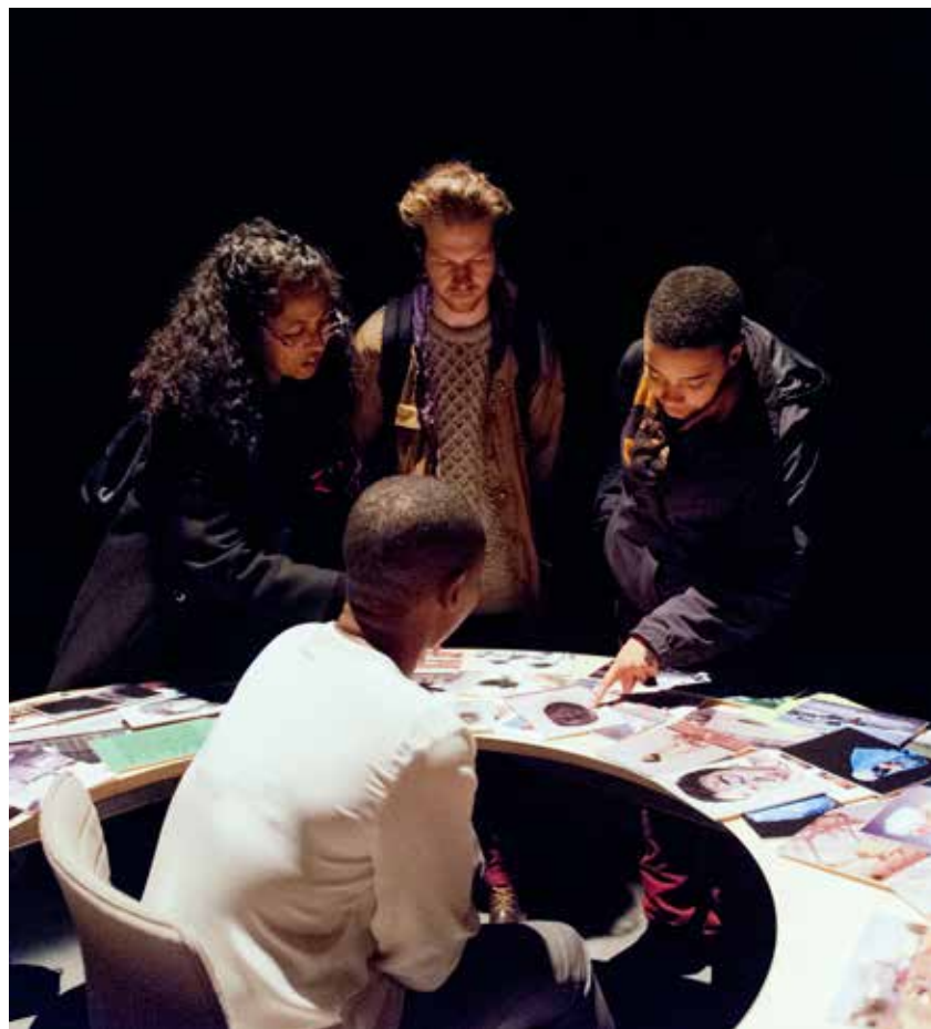
Contained Measures of Shifting States at "Across the board: Politics of Representation at Tate Modern", 2012.