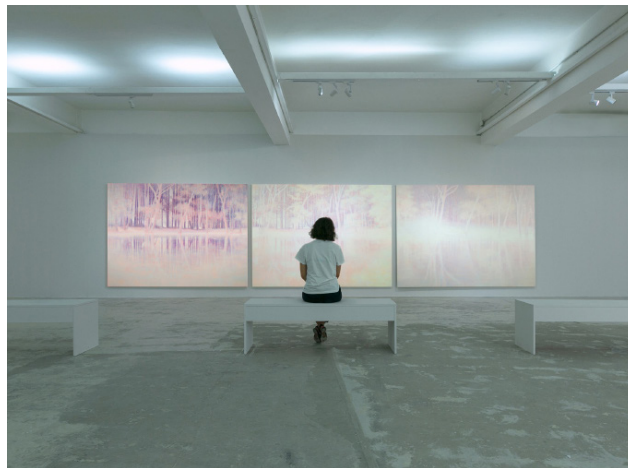
Vue d'exposition : Triptyque : Purple Glade, Pink Gleam and White Clearing Acrylique et huile sur toile, 215 x 290 cm

Les Paysages quantiques de Daniele Genadry Par Morad Montazami, juillet 2020