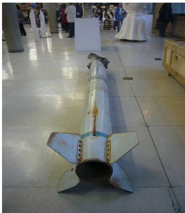
Vues de l'exposition Unlimited Bodies au palais d'Iéna, 13 - 24 octobre 2012