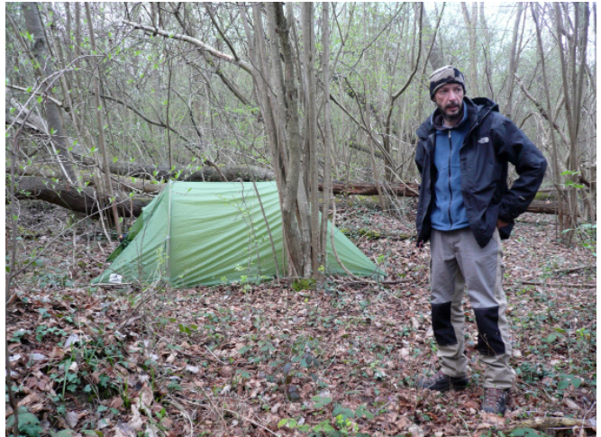
Laurent Tixador, Chasse à l'homme , 2011

28.03 - 25.04.2015 VERNISSAGE SAMEDI 04.04, 18-21H