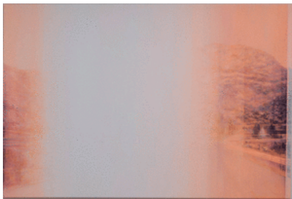
The Glow (proposals) install view: SMBA, Sept 2014 This is