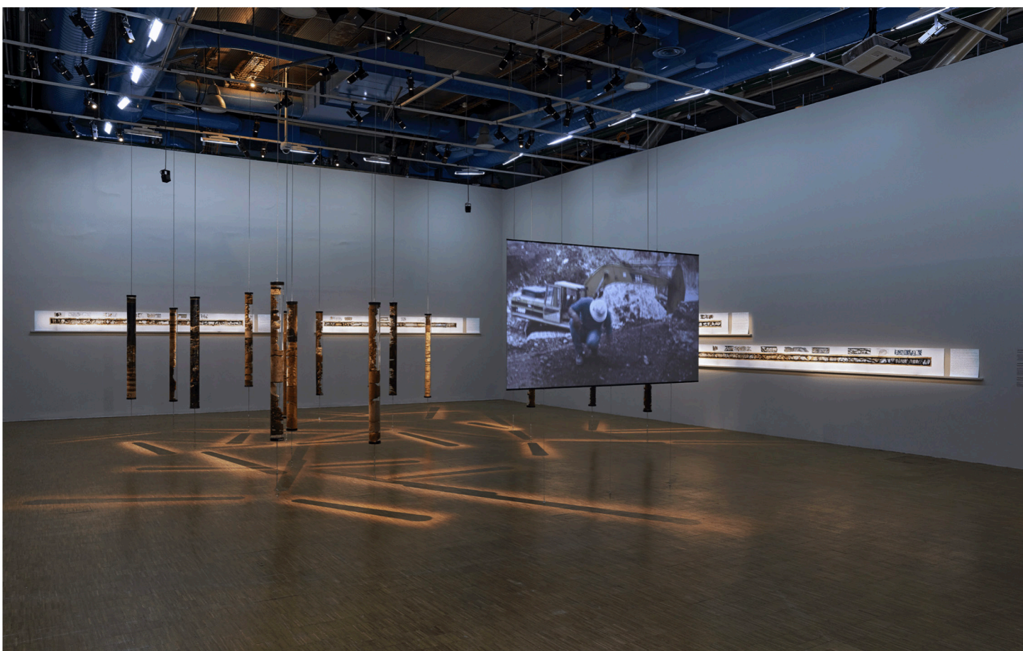
Vue d'installation des œuvres de Joana Hadjithomas et Khalil Joreige dans l'exposition du Prix Marcel Duchamp exhibition, Centre Pompidou, Paris, 2017. Avec l'aimable autorisation des artistes et In Situ - fabienne leclerc, Grand Paris. Photographie de Thomas Lannes.

« Un des moments marquants dans notre carrière est arrivé lors de notre première exposition, intitulée « Beyrouth Fictions Urbaines » avec comme sous-titre « L'Archéologie de notre Regard » (1997) à l'Institut du Monde Arabe. Ce premier projet nous a permis de réfléchir, par le biais de la photographie, à la manière dont notre regard s'est constitué et transformé dans le temps. La dernière œuvre de cette exposition, Le Cercle de confusion (1997), présente une photographie de Beyrouth découpée en 3000 morceaux, où chaque fragment est marqué au verso par la phrase « Beyrouth n'existe pas ». Les visiteurs étaient invités à choisir et à emporter un fragment de cette image qui, en disparaissant, laissait apparaître un miroir qui renvoyait à chacun sa propre image. C'est une œuvre que l'on présente encore très souvent et qui a marqué un moment déclencheur dans notre pratique où nous avons compris que nous ne ferions pas de photographie traditionnelle et qu'un territoire, comme le Liban, peut agir comme un indice révélateur, sentinelle de l'état du monde. »