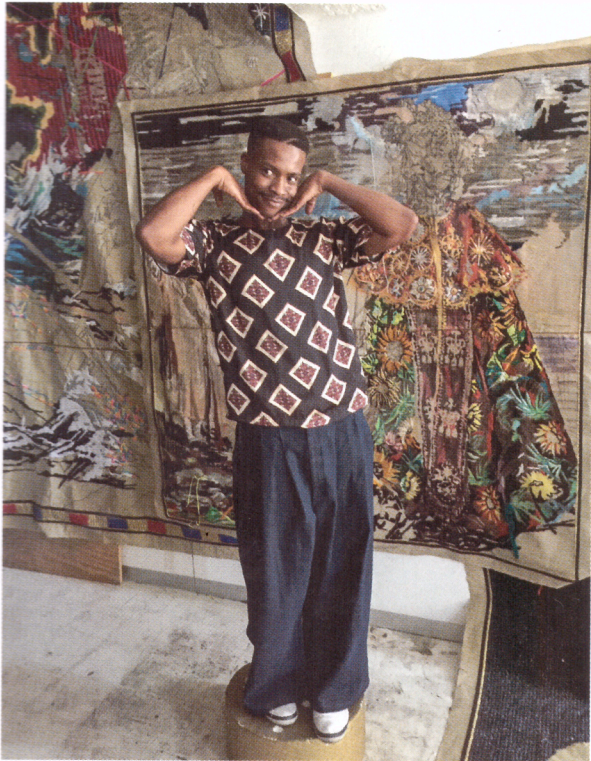
Athi-Patra Ruga dans son atelier du Cap, 2017.