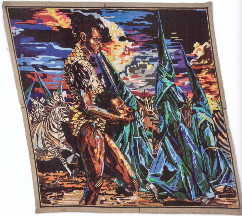
ATHI-PATRA RUGA The Votive Procession (To Exile) 2015, laine et fils sur toile de tapisserie, 195 x 195 cm.